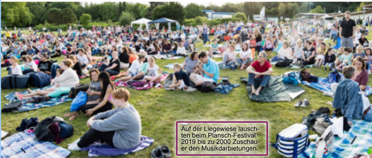
Auf der Liegewiese lauschen beim Plansch-Festival 2019 bis zu 2000 Zuschauer den Musikdarbietungen.